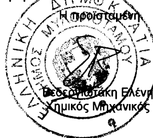
Τσουκάκη Ελένη Μηχανικός Μηχανικός